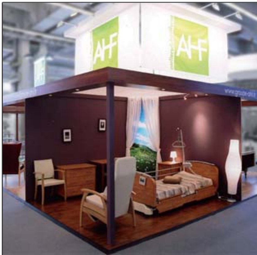
AHF - Geront-Expo