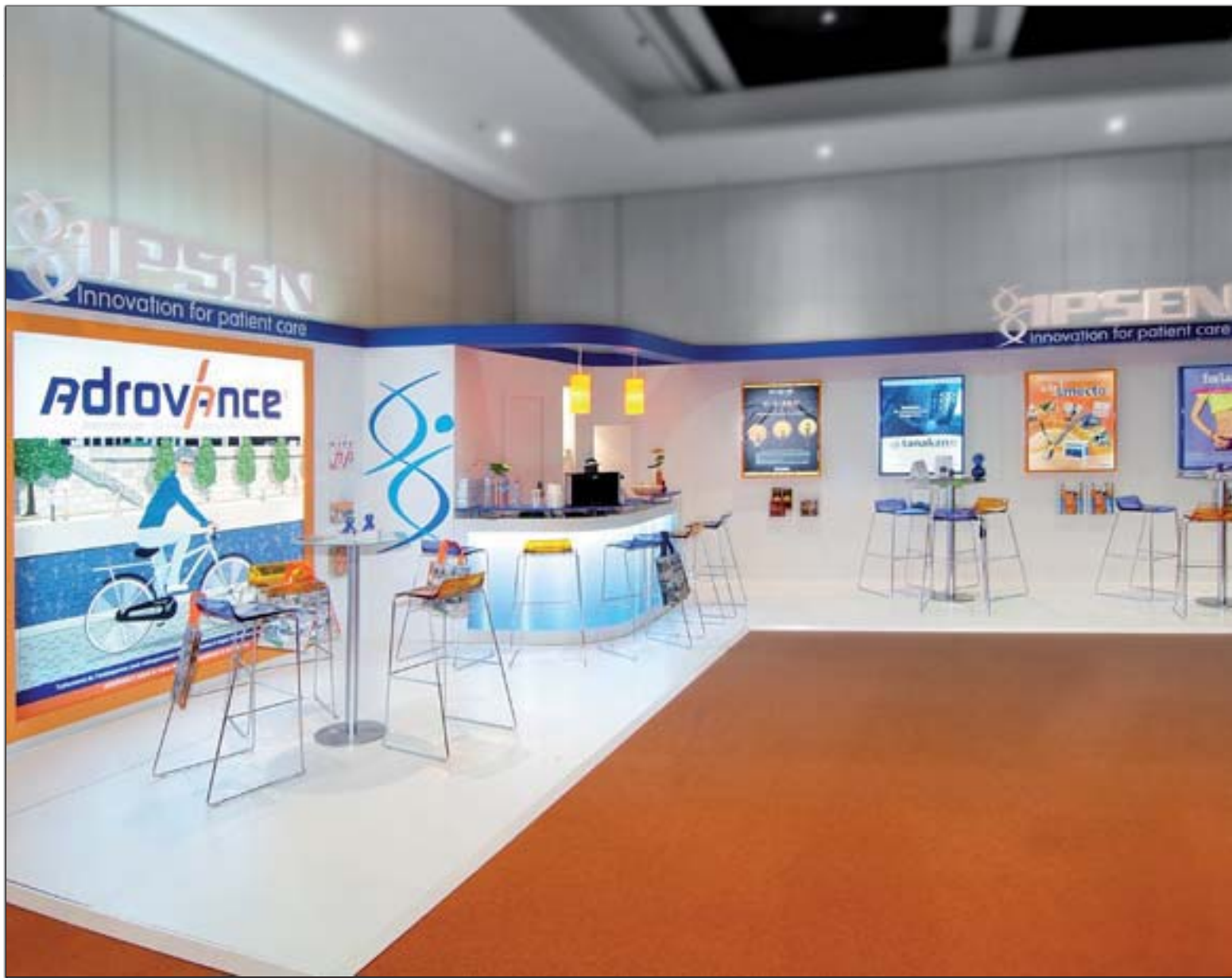
IPSEN - JNMG (Journées Nationales de Médecine Générale)