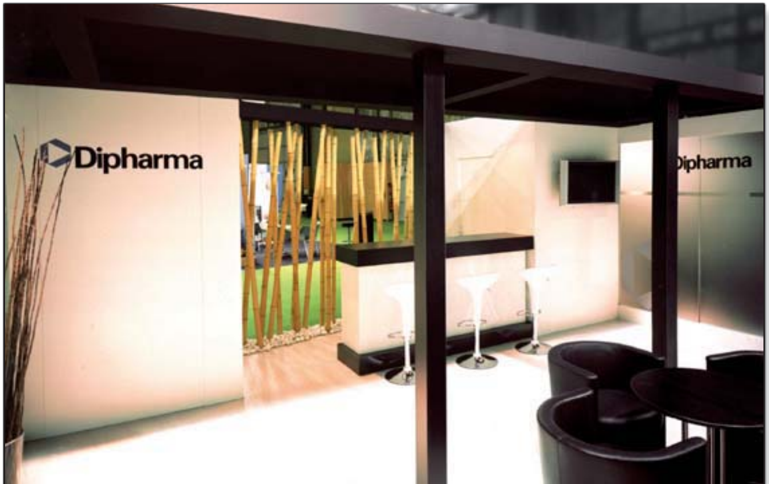
DIPHARMA - CPhI - (Détail)