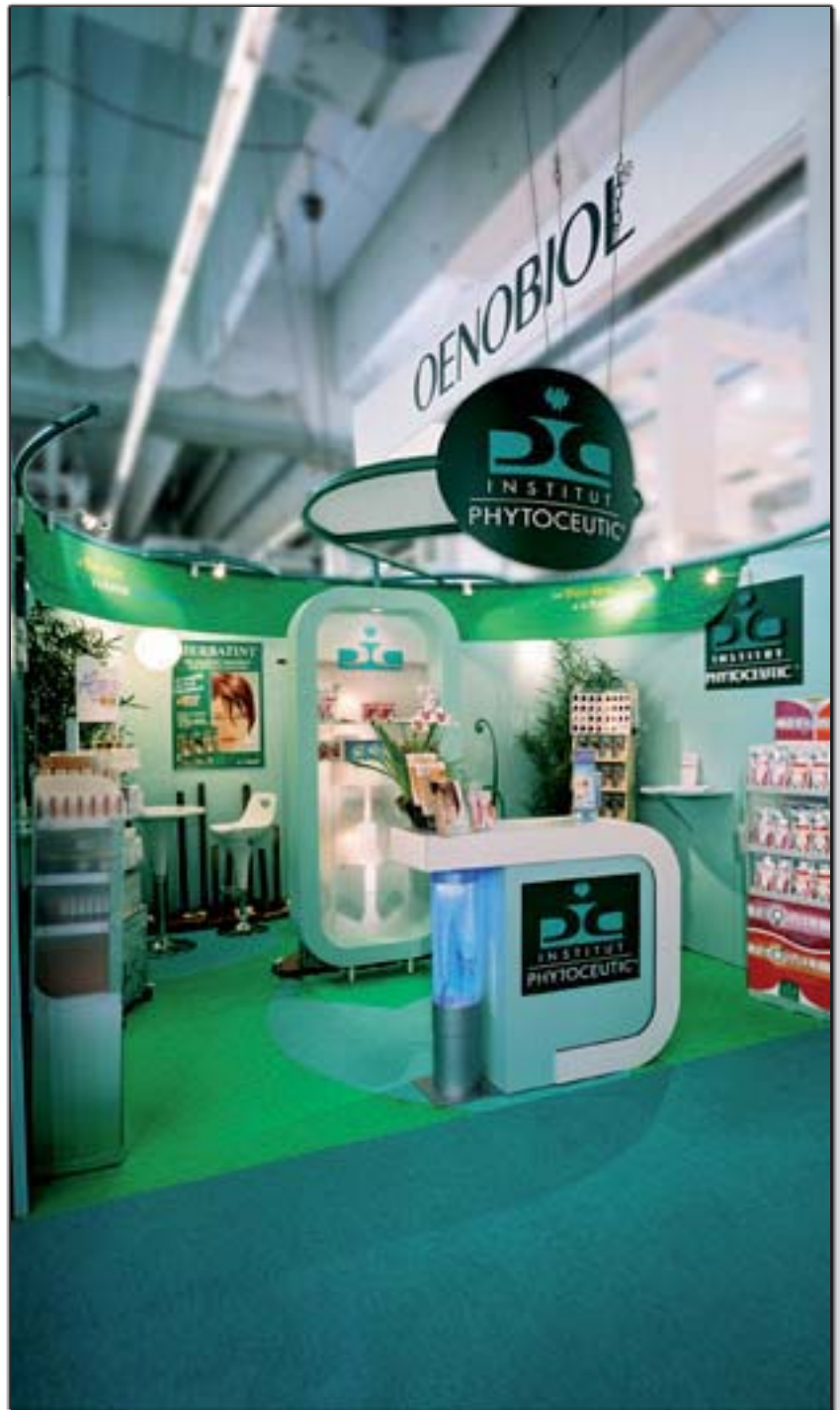
PHYTOCEUTIC - Pharmagora