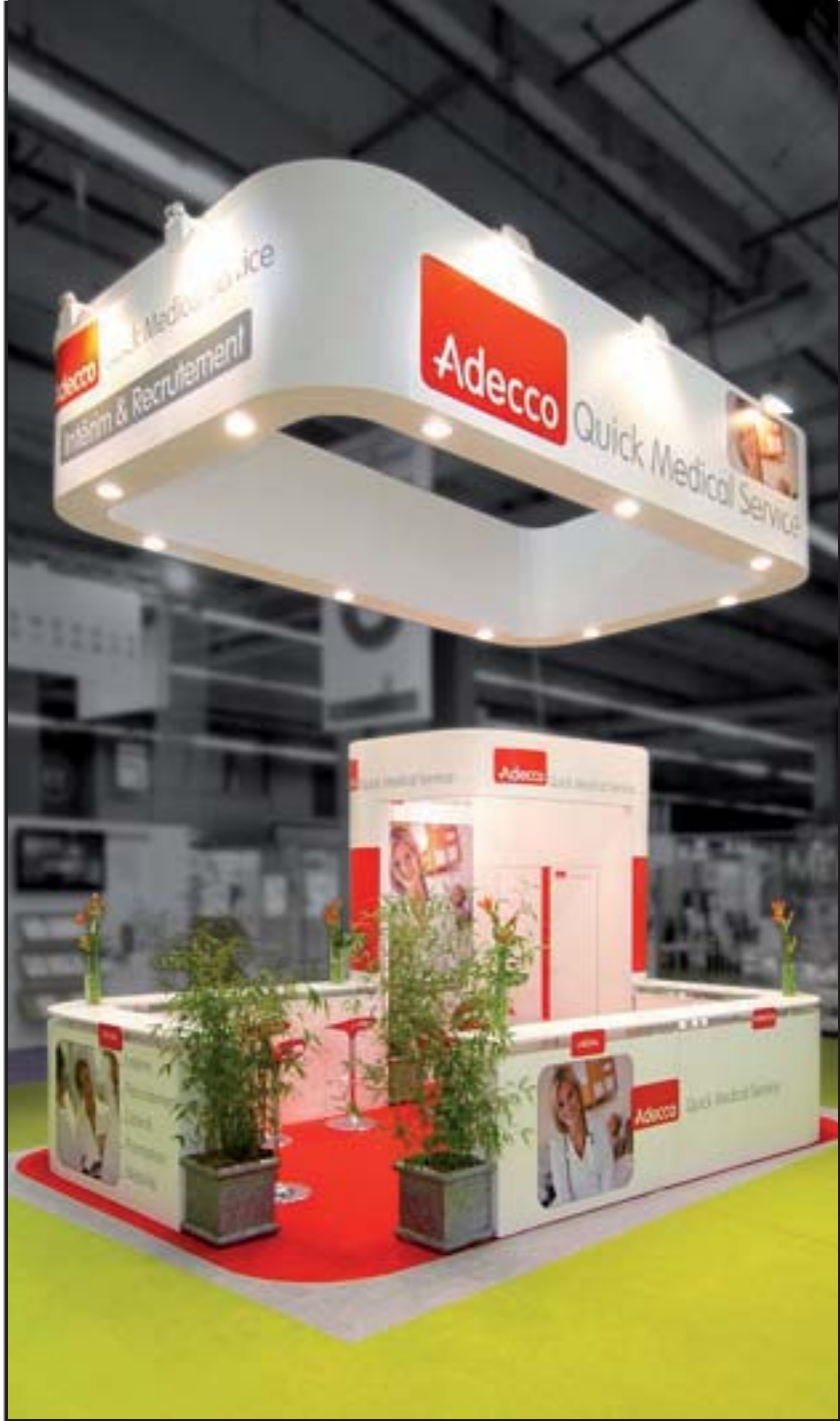
ADECCO - Salon Infirmier