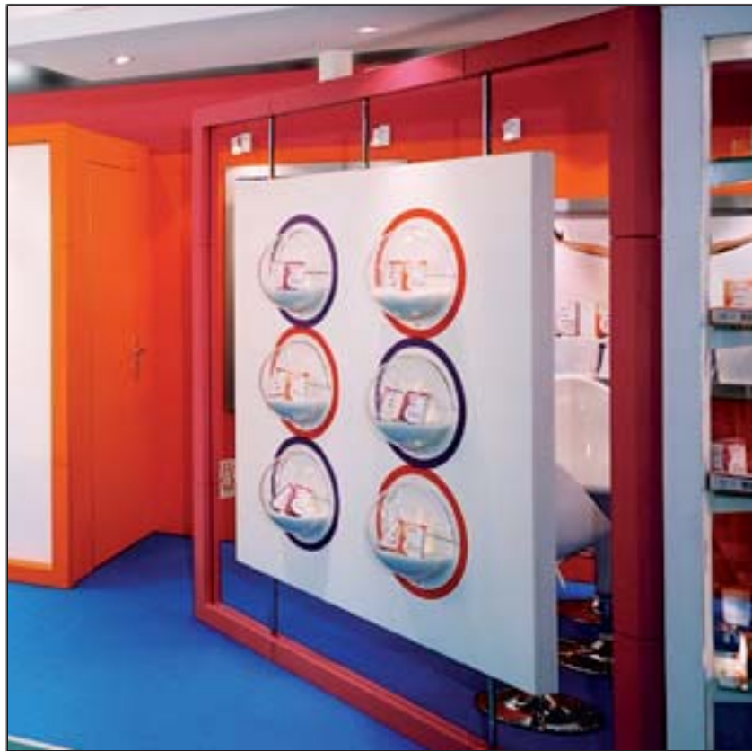
LABO LERO - Pharmagora