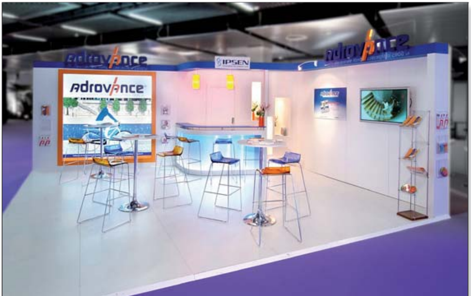
IPSEN-ADROVANCE - SFR (Société Française de Rhumatologie)