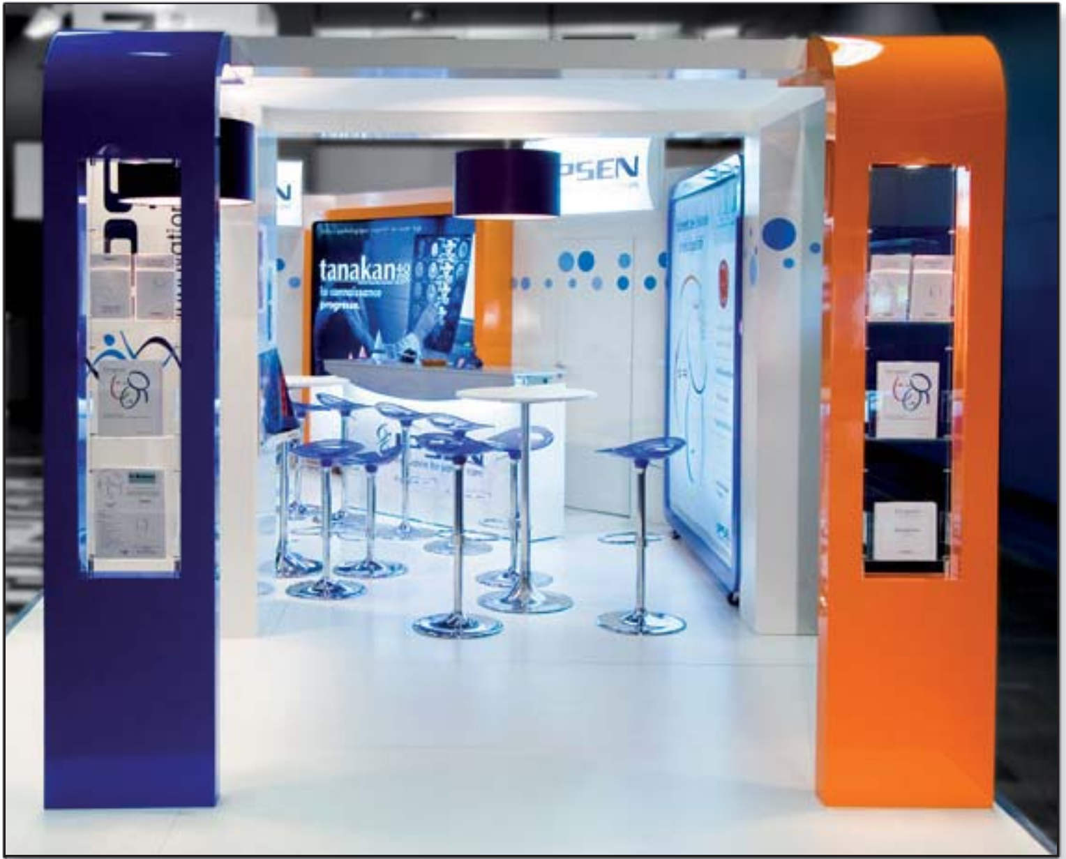
IPSEN - JNLF (Journées de Neurologie de Langue Française)