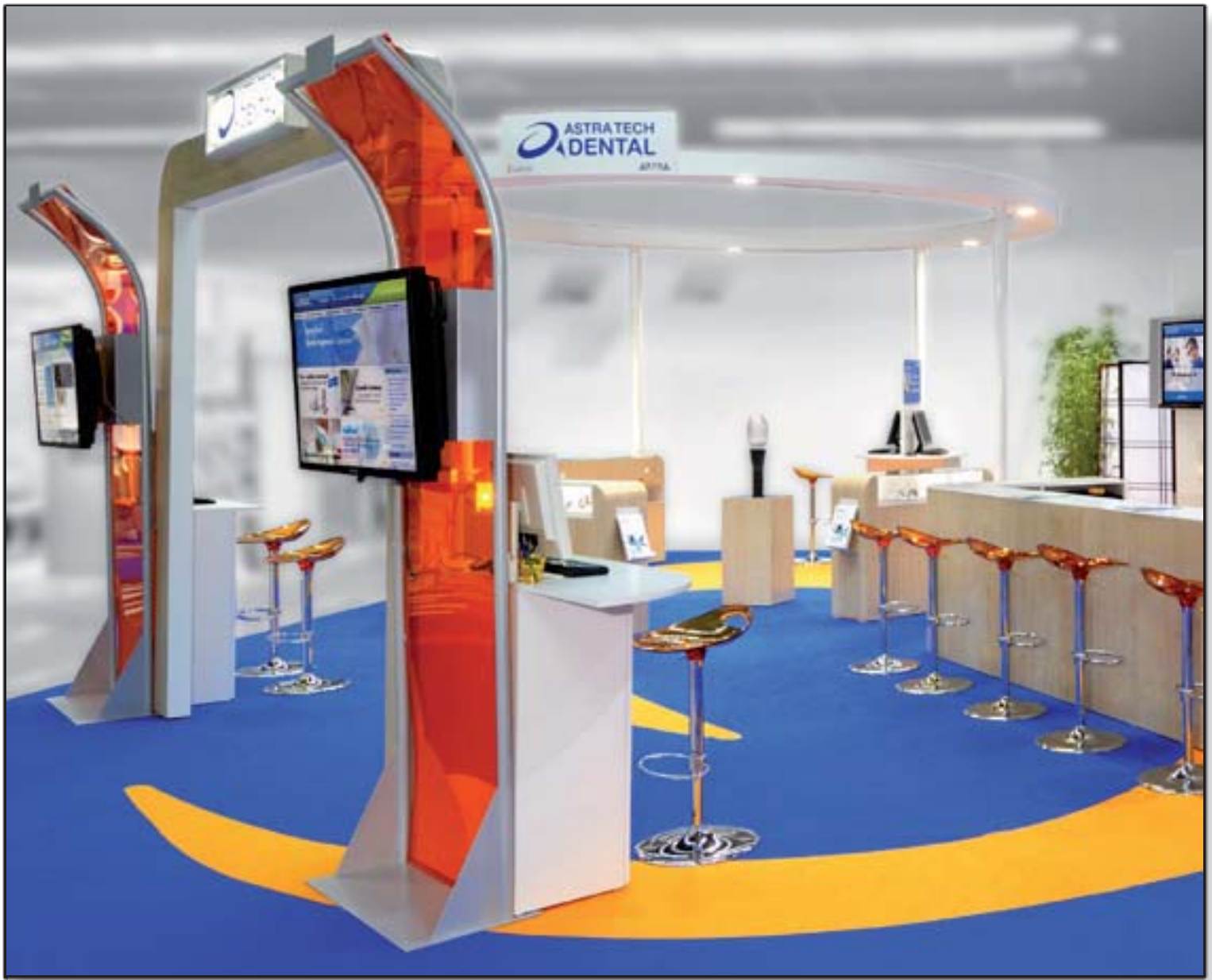
ASTRATECH - ADF (Association de Dentistes de France)