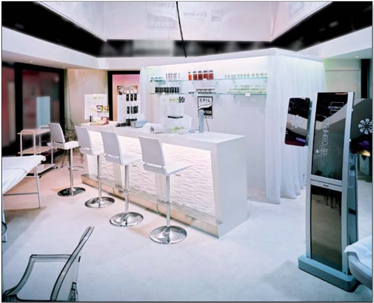
EPIL CENTER - Franchise Expo