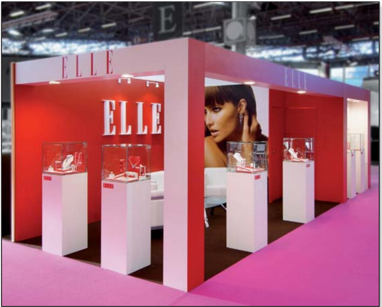
ELLE - Orhopa