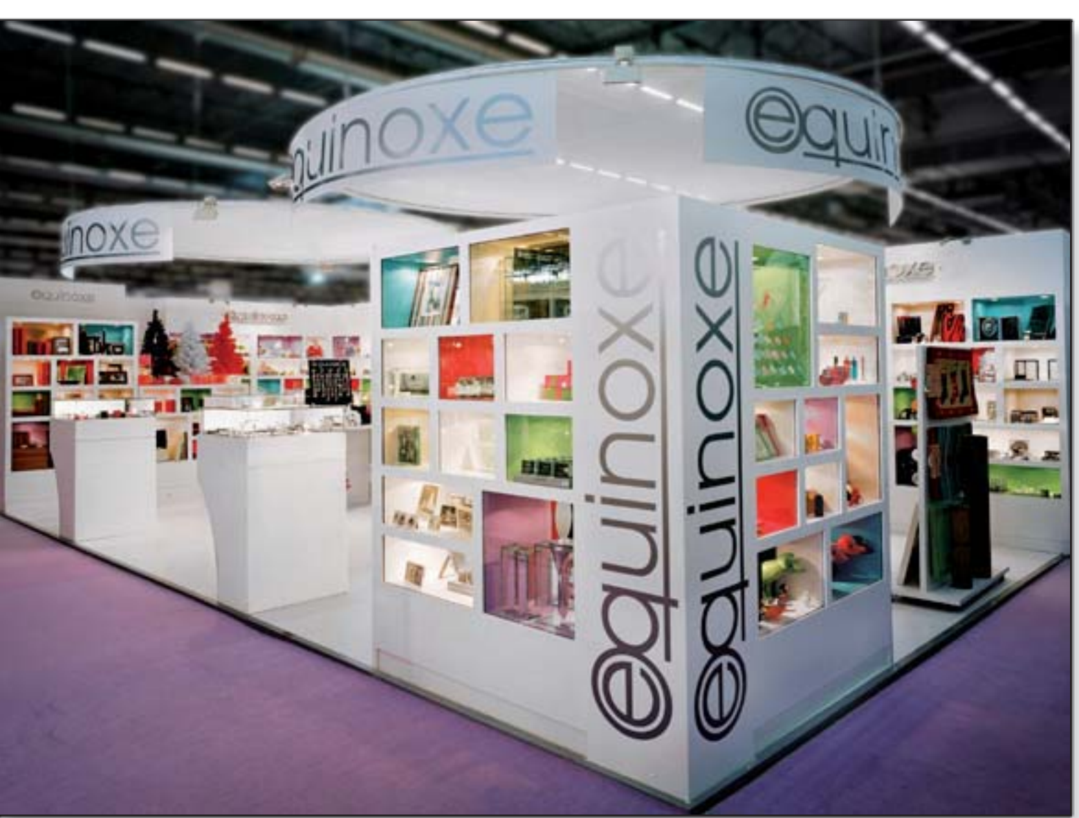
EQUINOXE - Maison & Objet