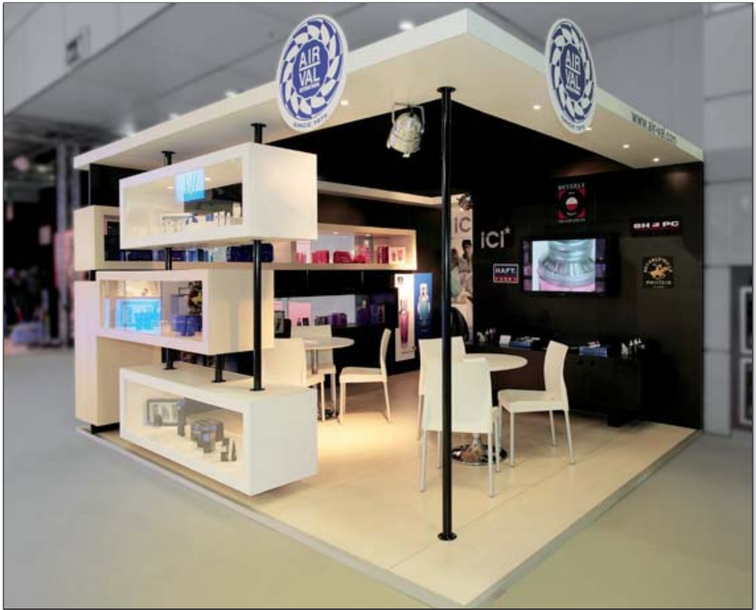
AIR VAL - Cosmoprof - Bologne