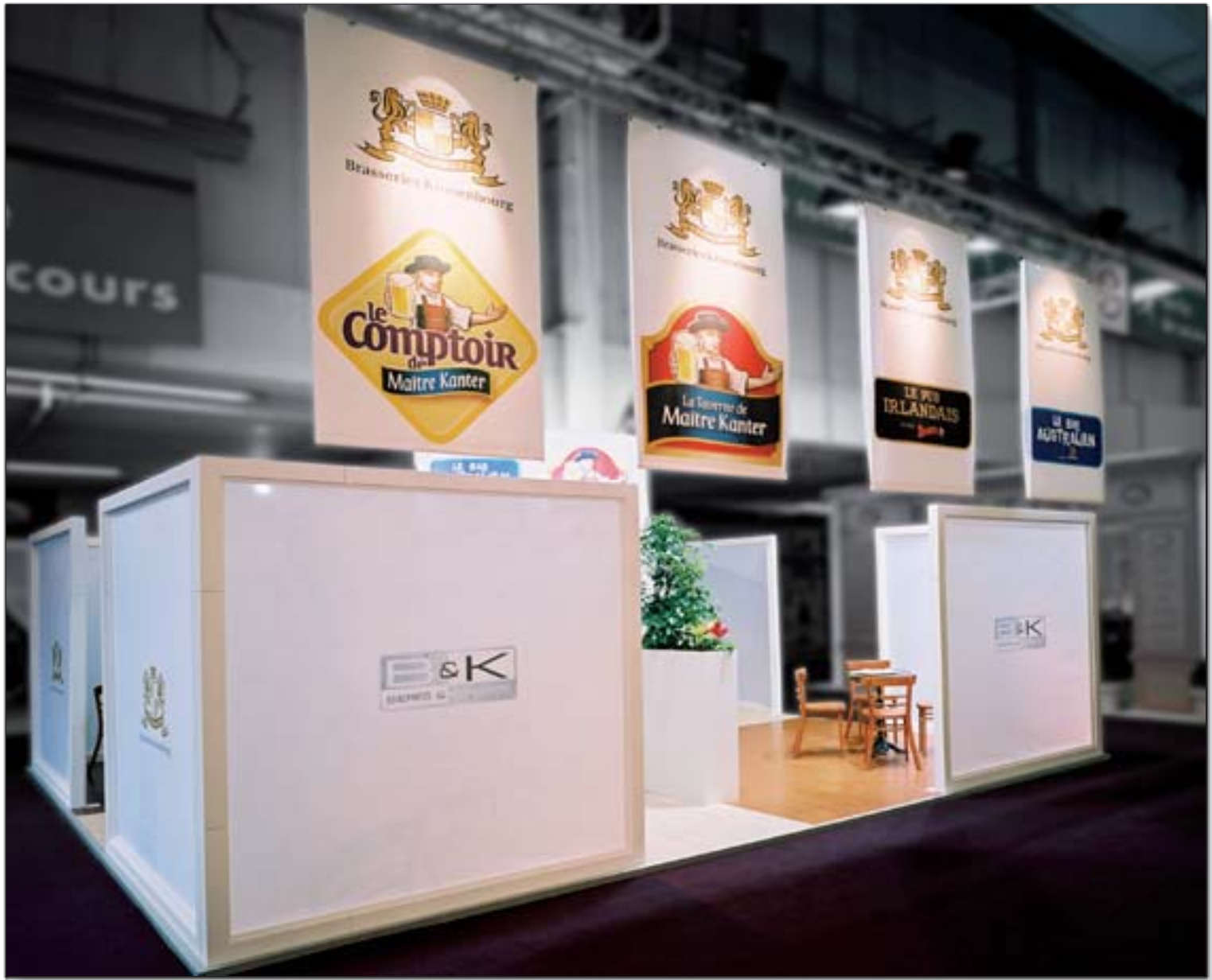
KRONENBOURG - Franchise Expo