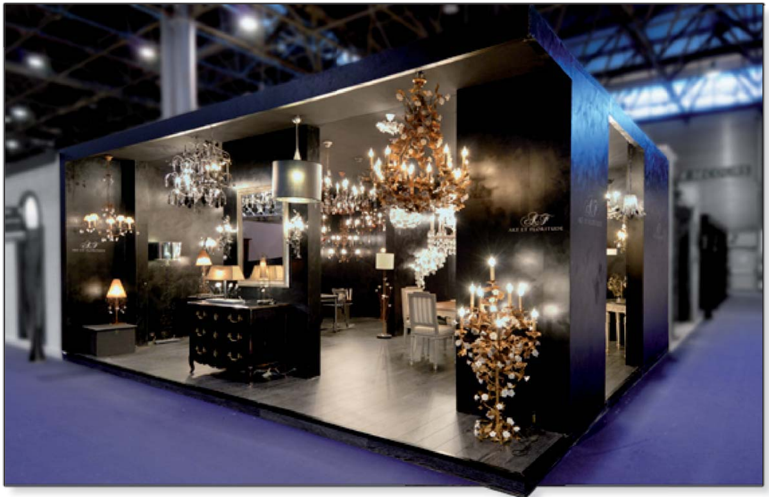
ART & FLORITUDE - Maison & Objet