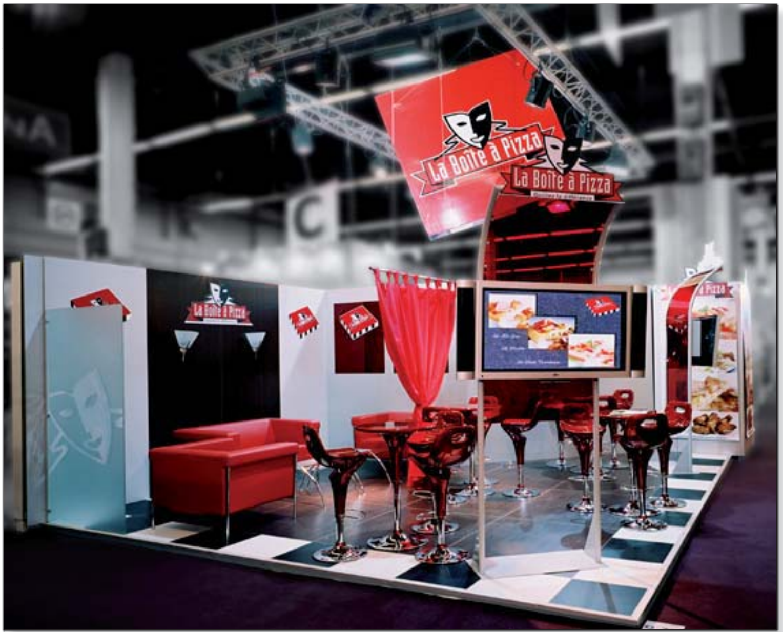
La BOITE à PIZZA - Franchise Expo