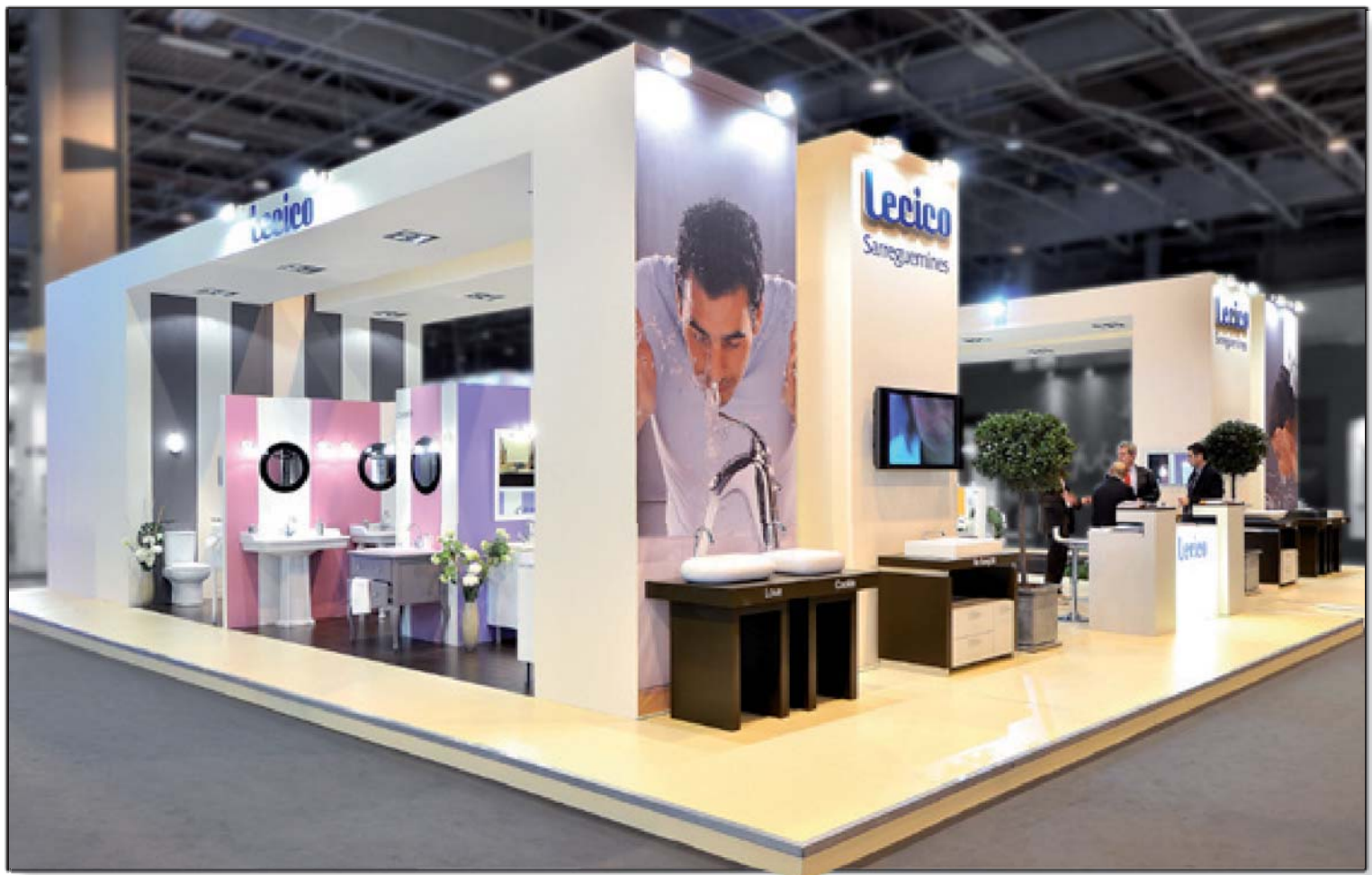
LECICO - Ideobain