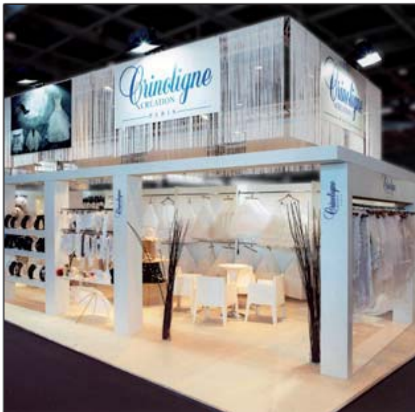
CRINOLIGNE - Mode & Mariage