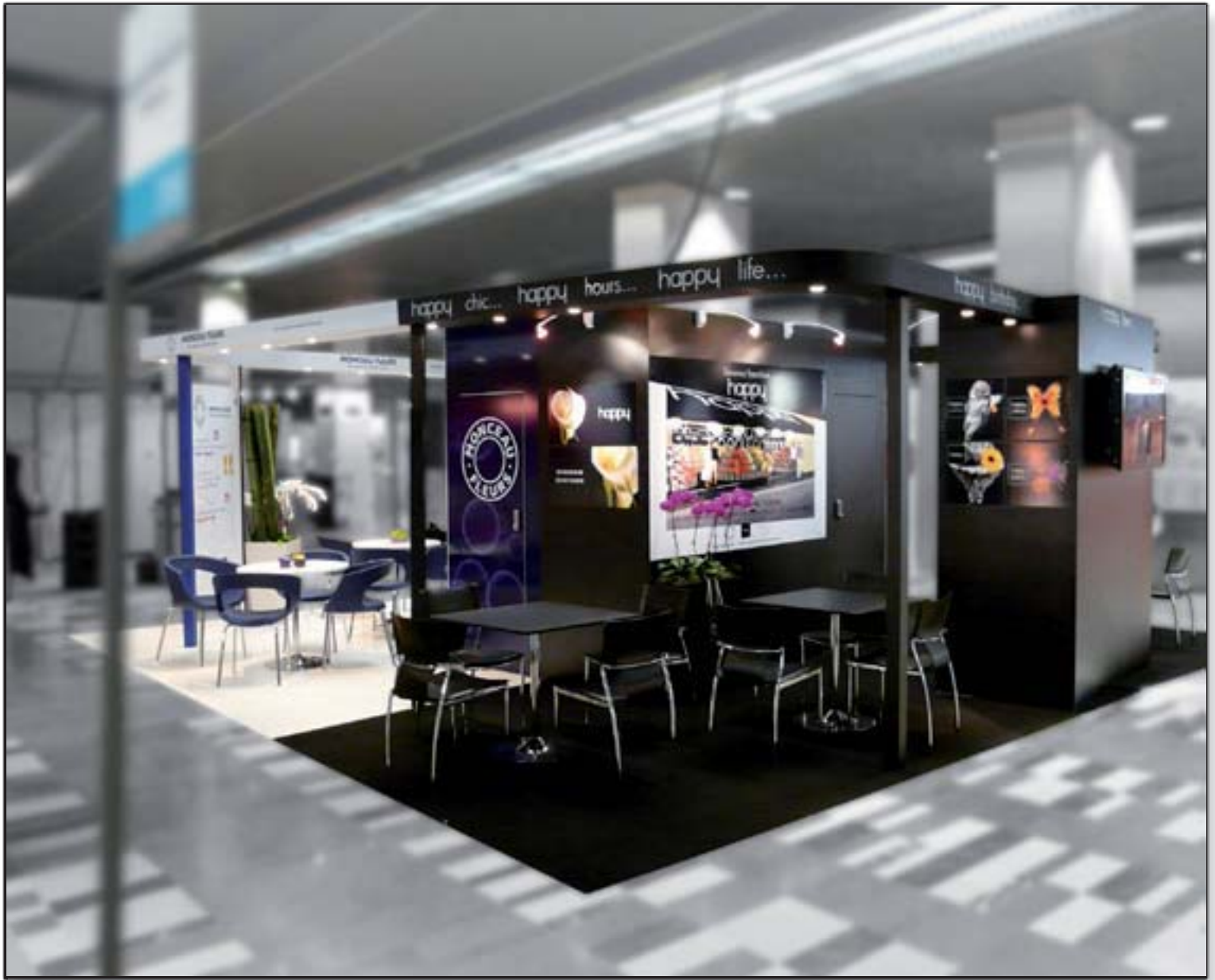
MONCEAU / HAPPY - Salon Entrepreneurs