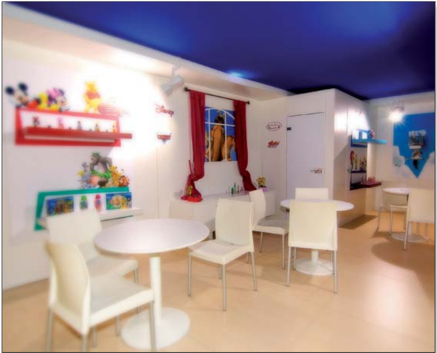
AIR VAL - Beyond Beauty