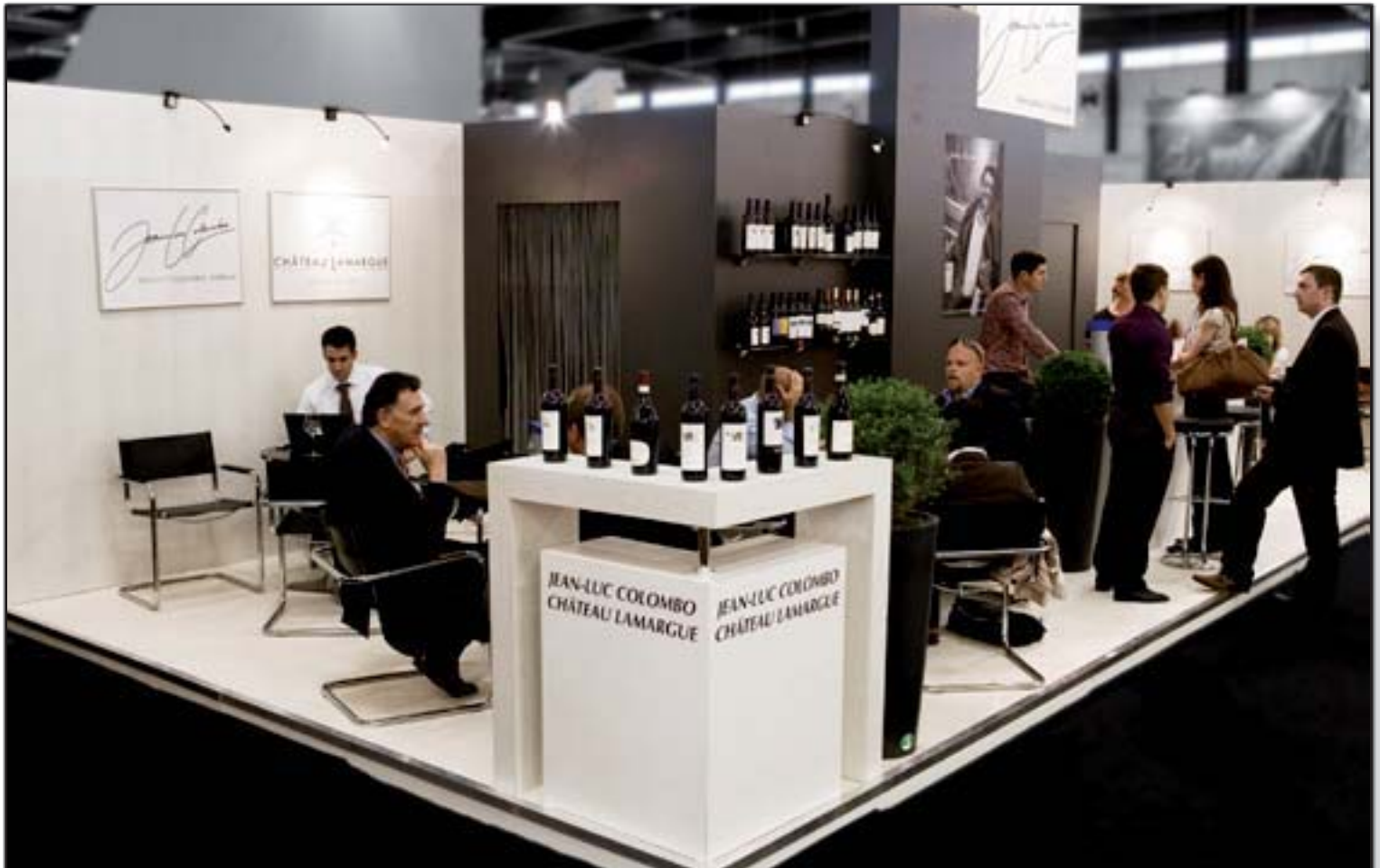
COLOMBO - Vinexpo