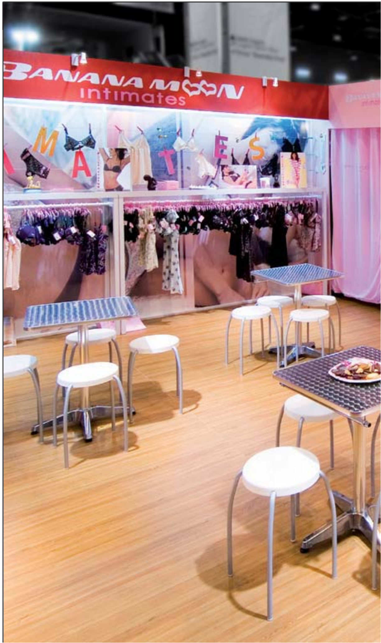
BANANA MOON - Lingerie