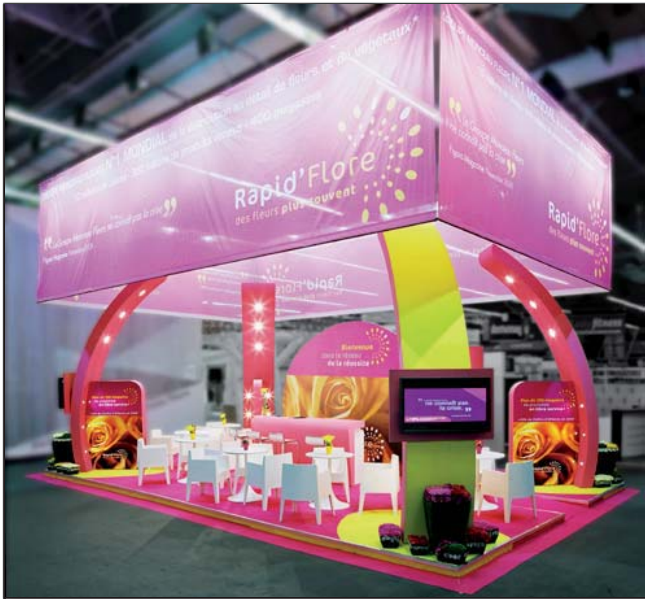
RAPID' FLORE - Franchise Expo