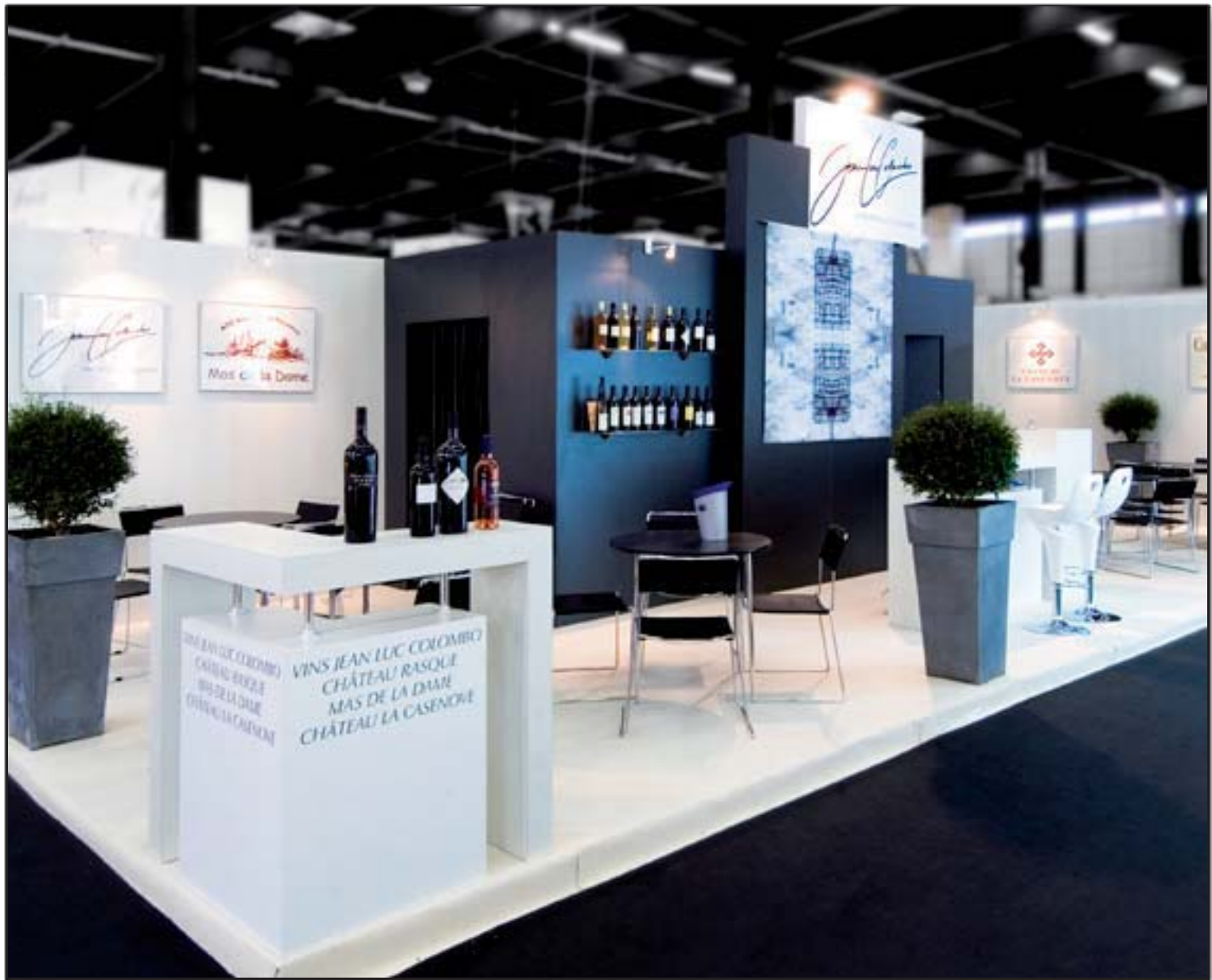
COLOMBO - Vinexpo