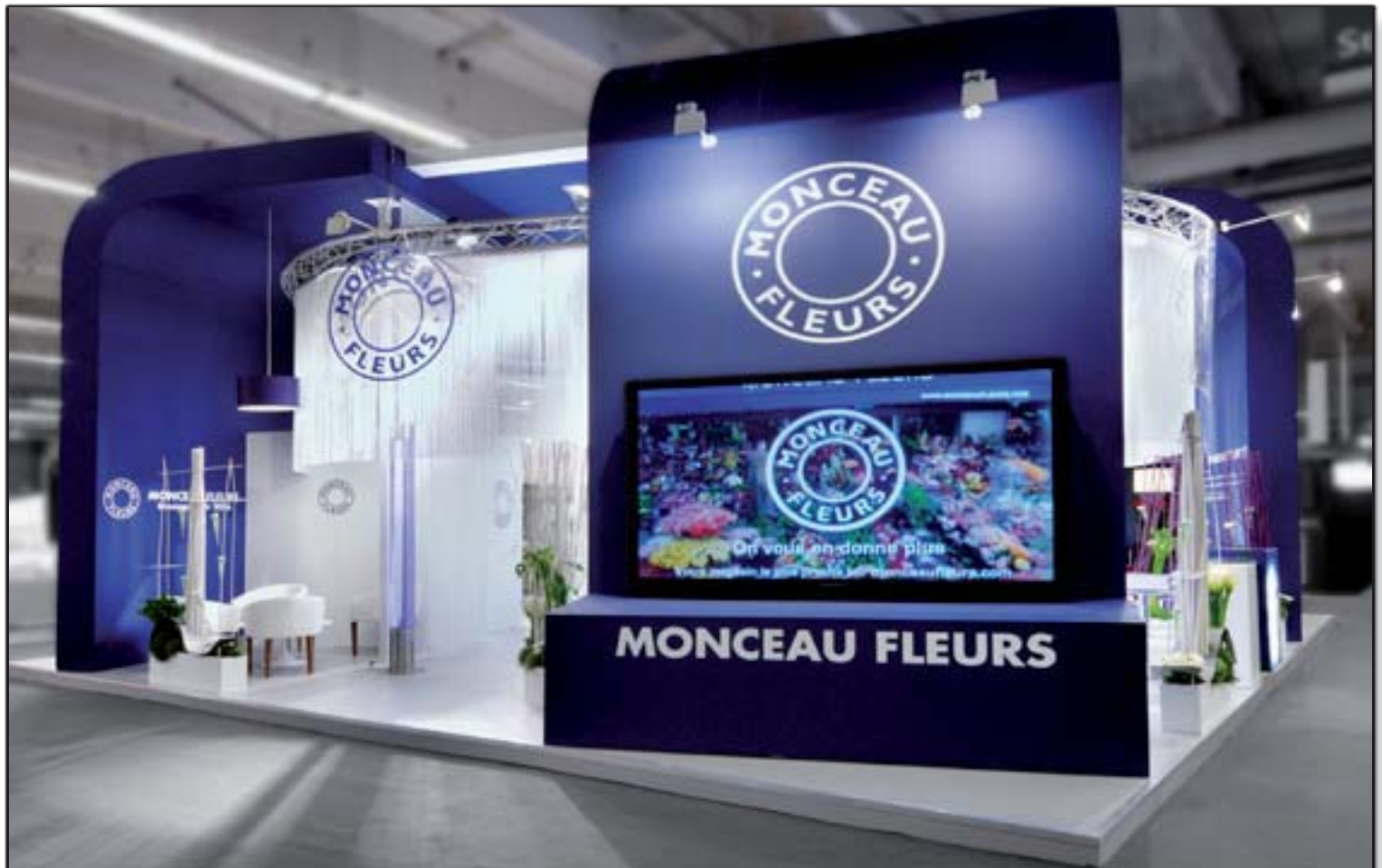
MONCEAU - Franchise Expo