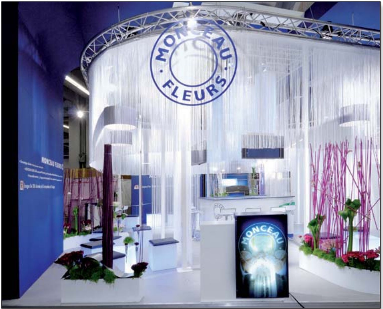
MONCEAU - Franchise Expo