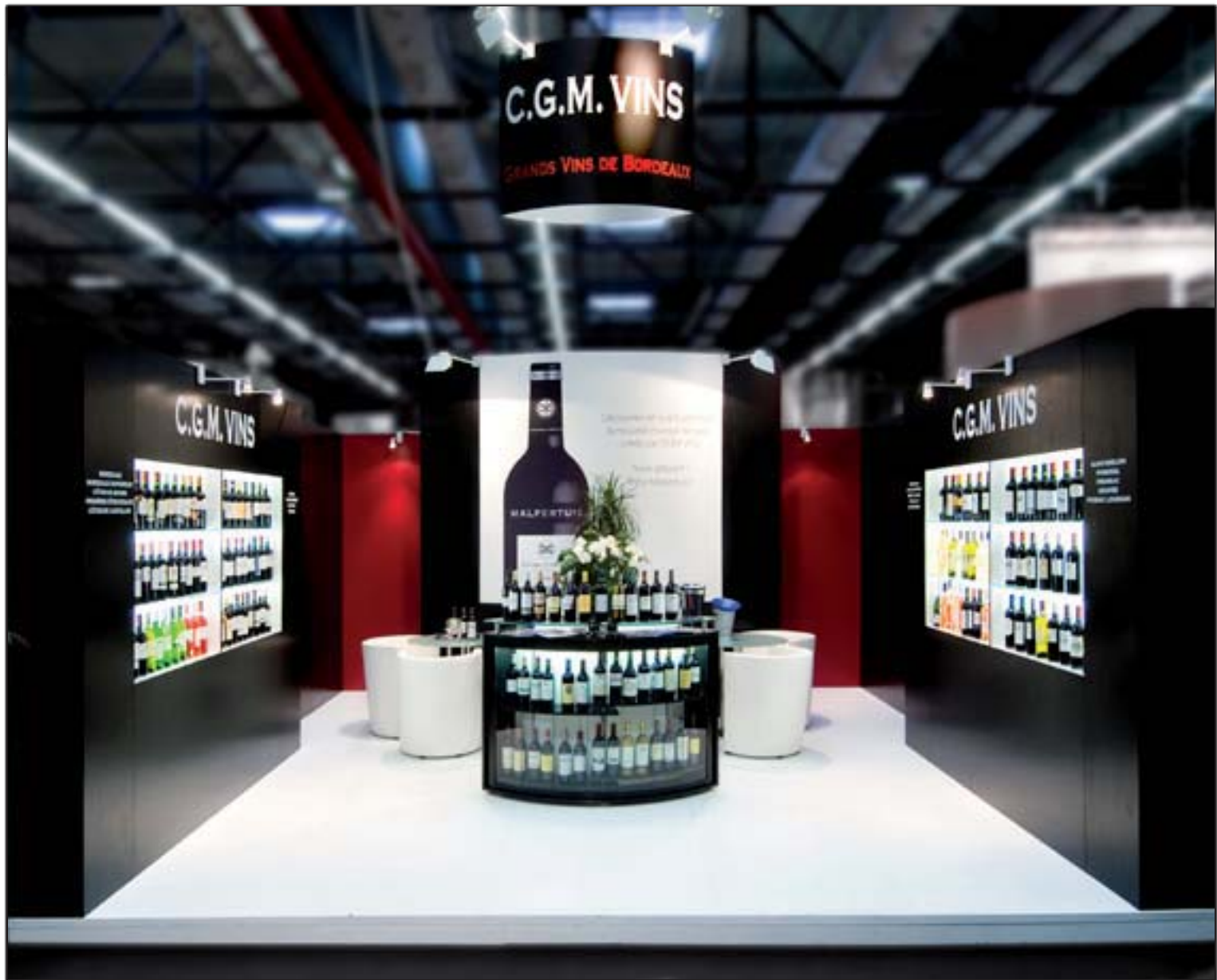
CGM VINS - Vinexpo