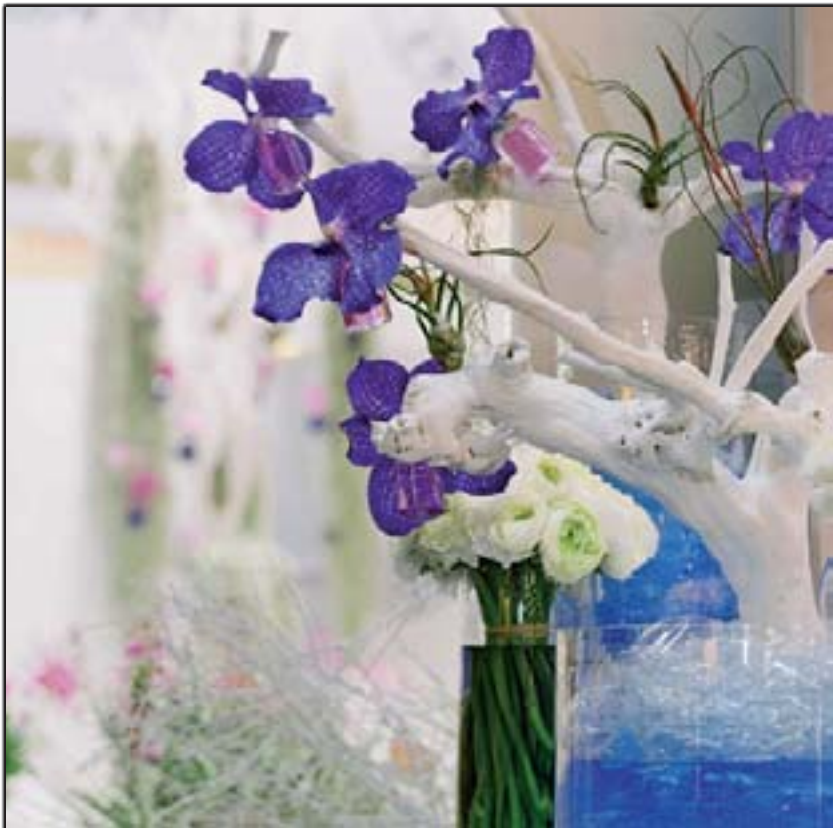
MONCEAU - Franchise Expo - (Détails)