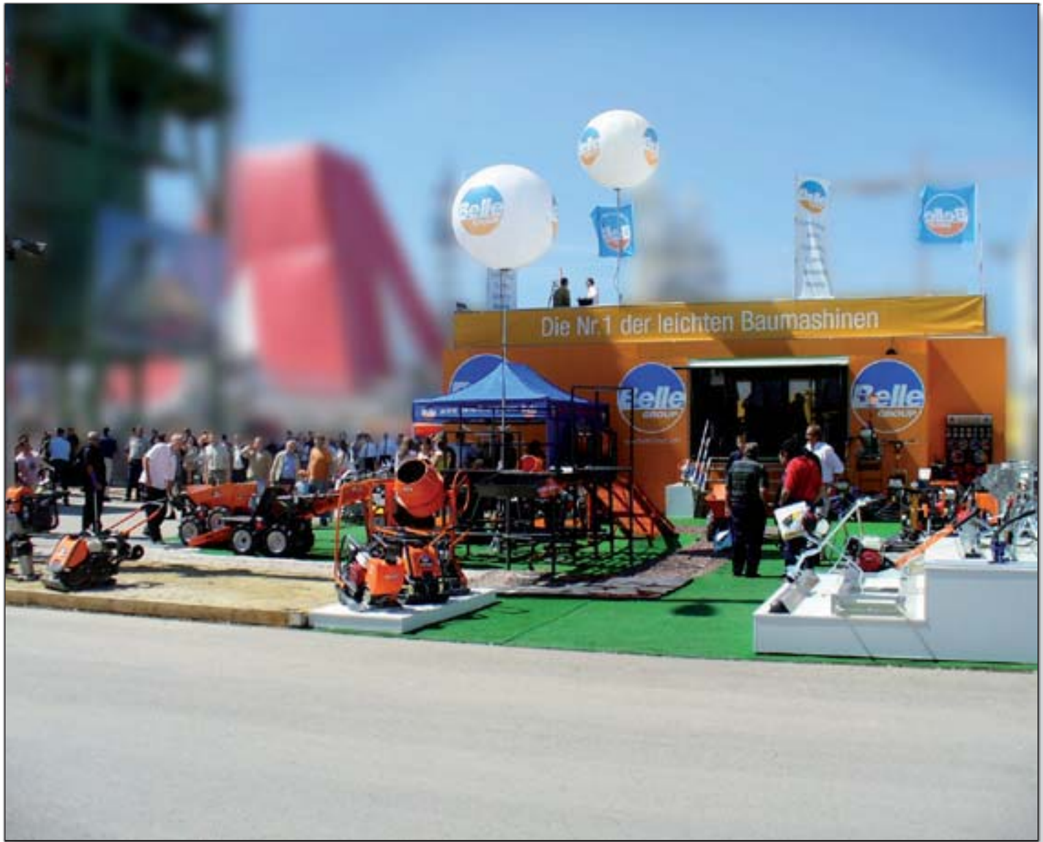
BELLE GROUP - Labauma