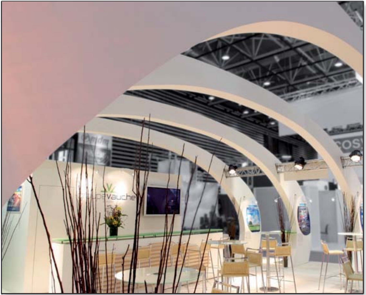
VAUCHE - Pollutec