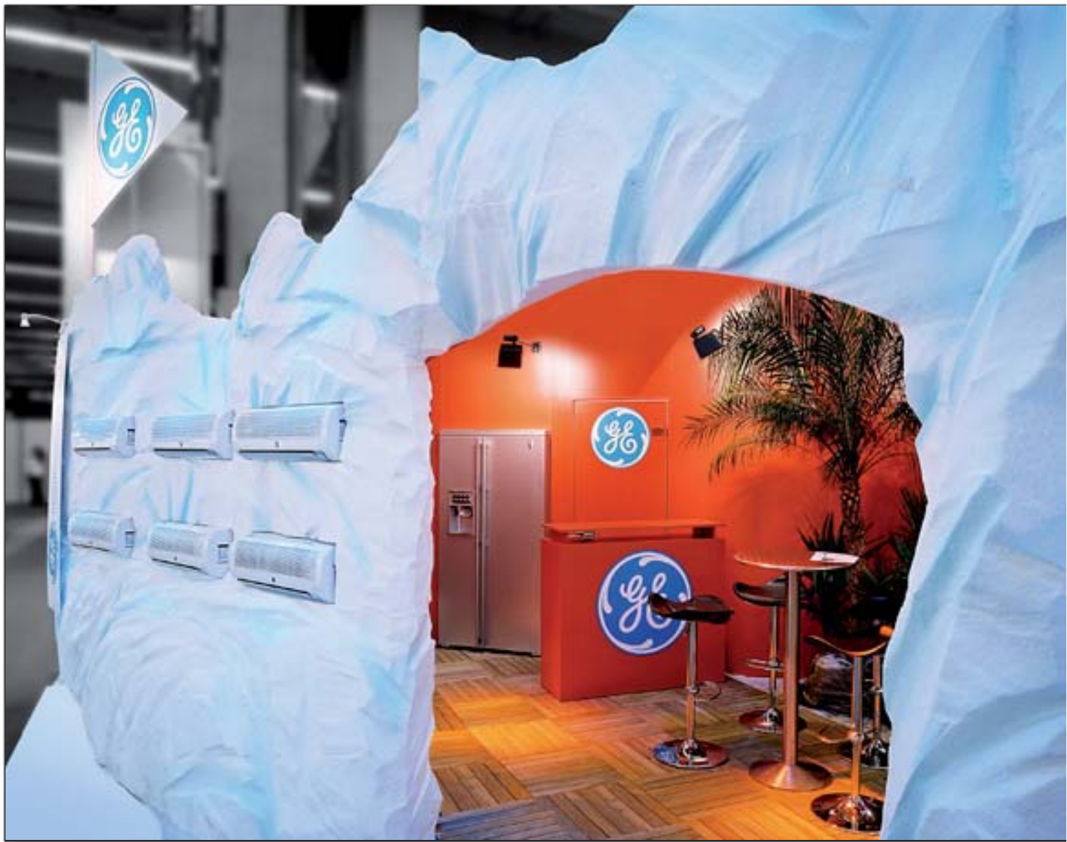
GENERAL ELECTRIC - Interclima