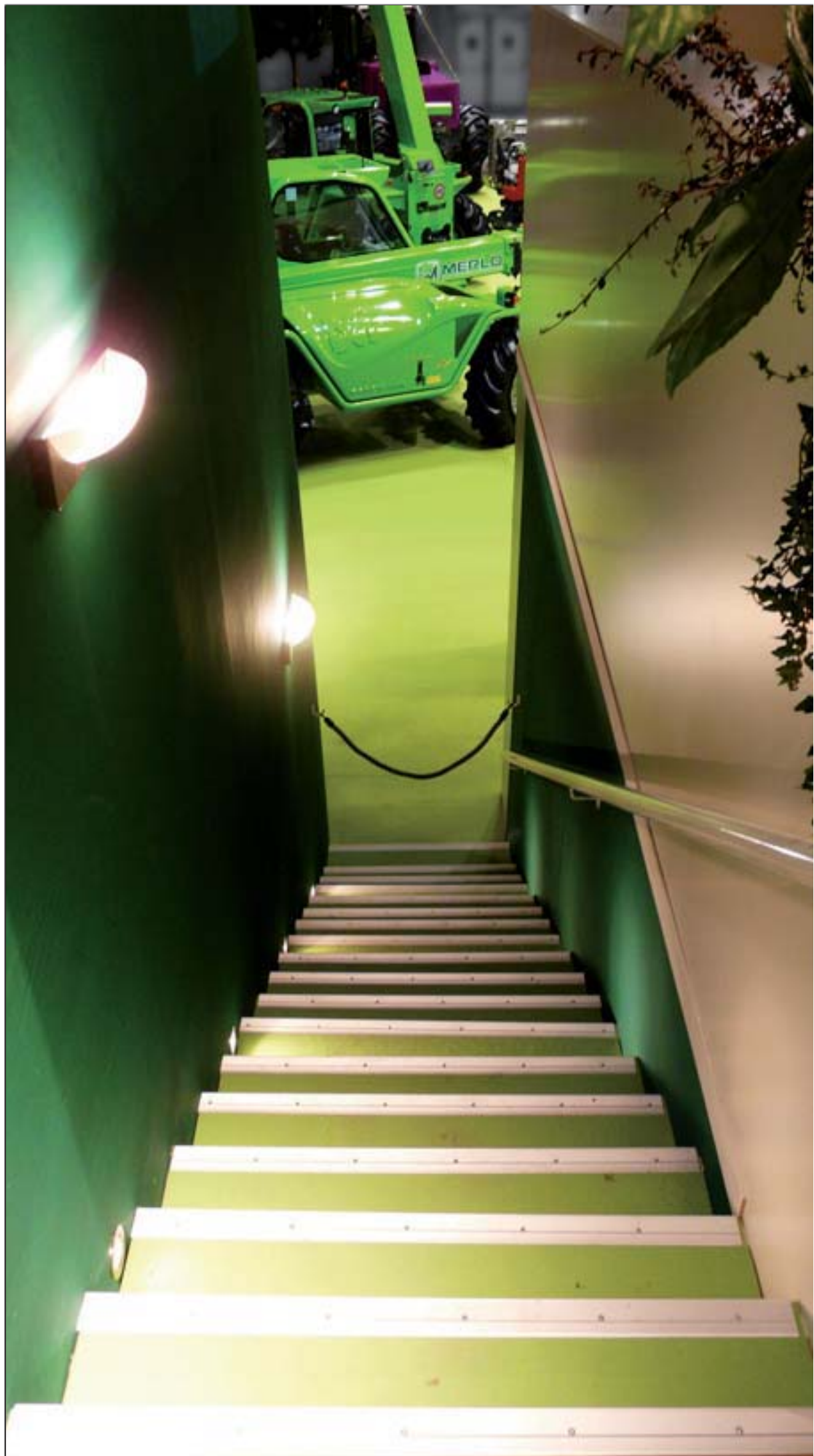
MERLO - SIMA (Détail d'accès au lounge)