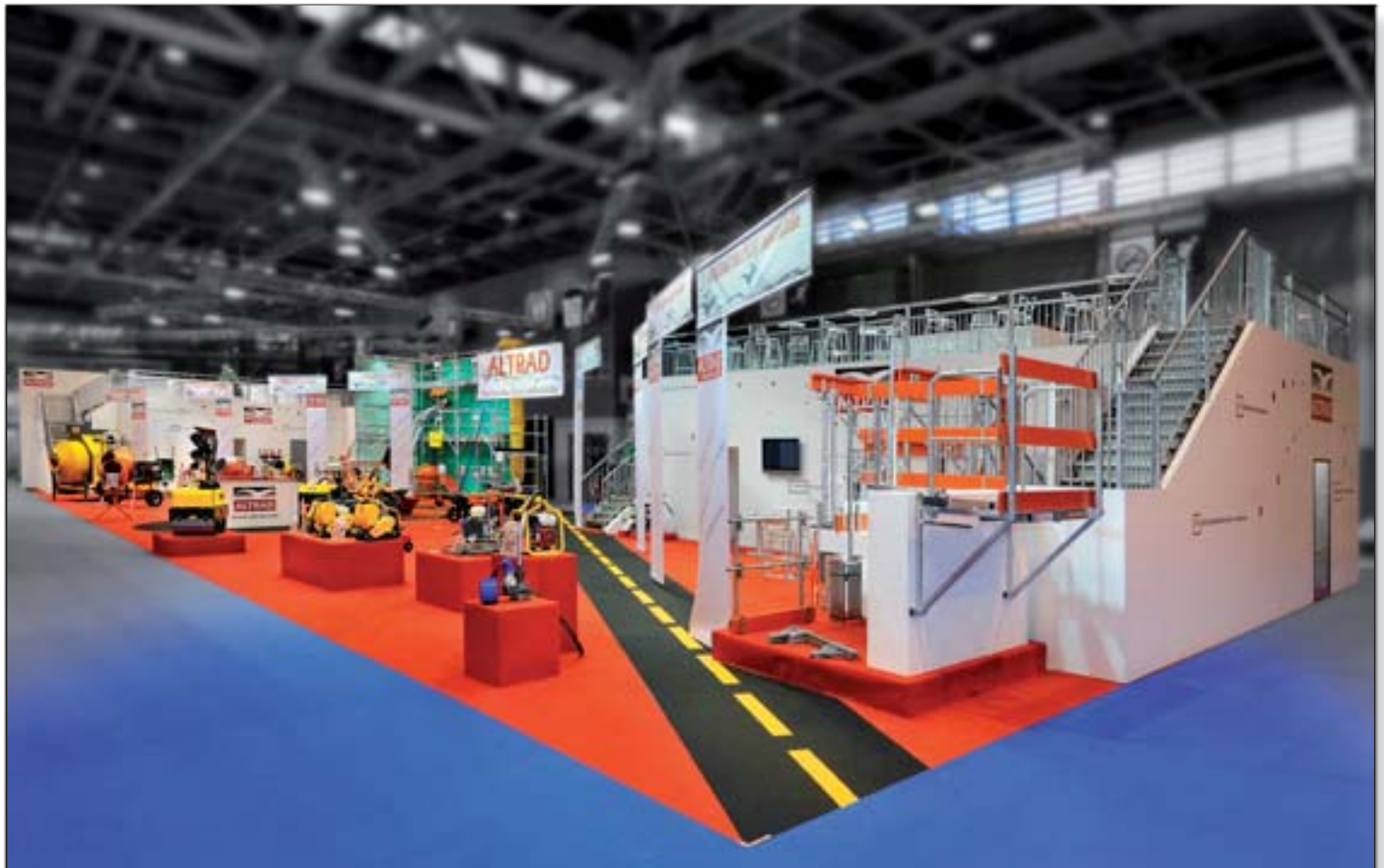
ALTRAD - Batimat