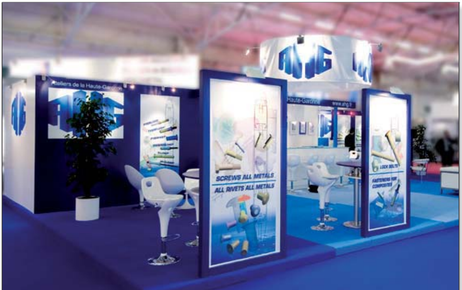
AHG (Ateliers de la Haute Garonne) - Le Bourget SIA