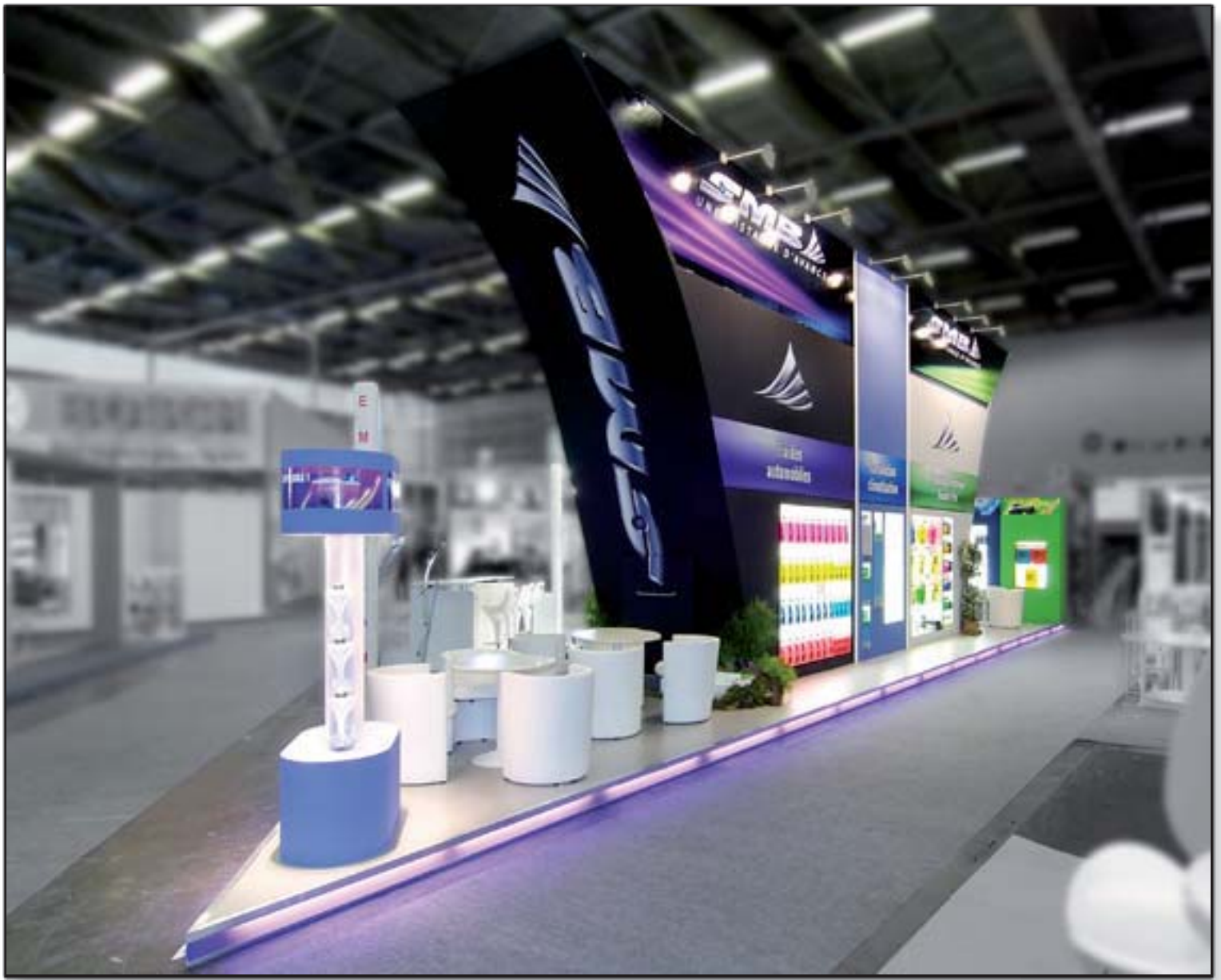
SMB - Equip' Auto