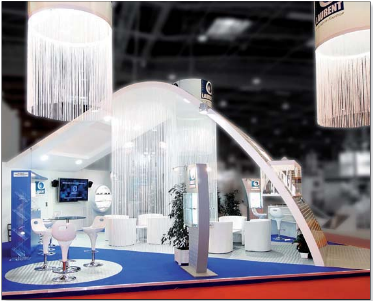
LAURENT FIXATION - Batimat