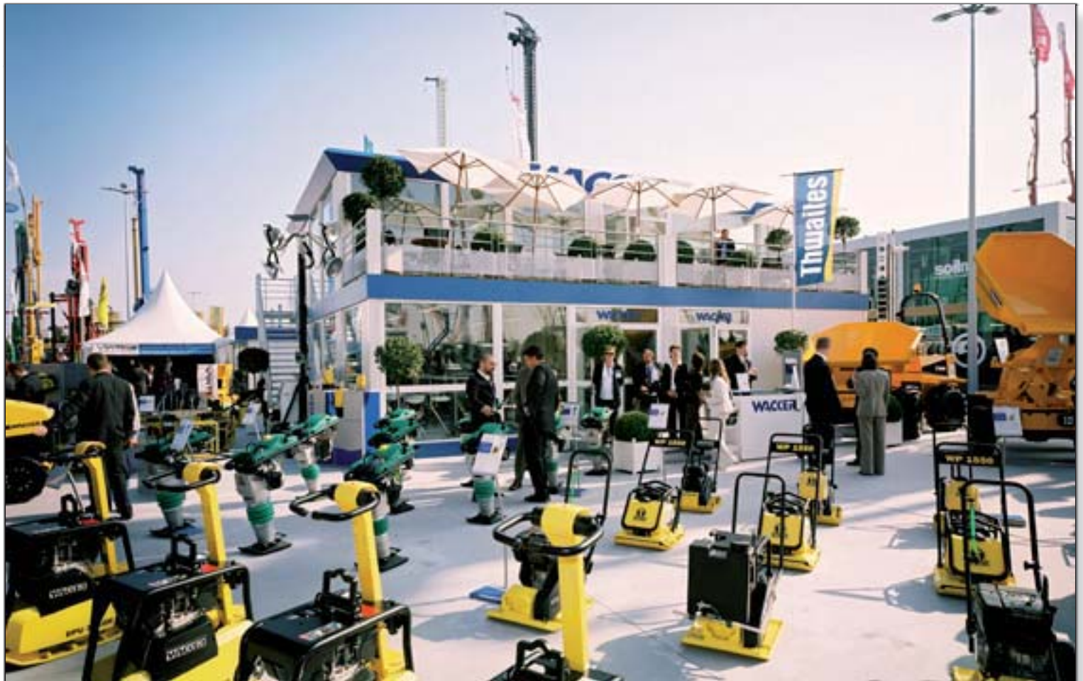
WACKER - InterMat