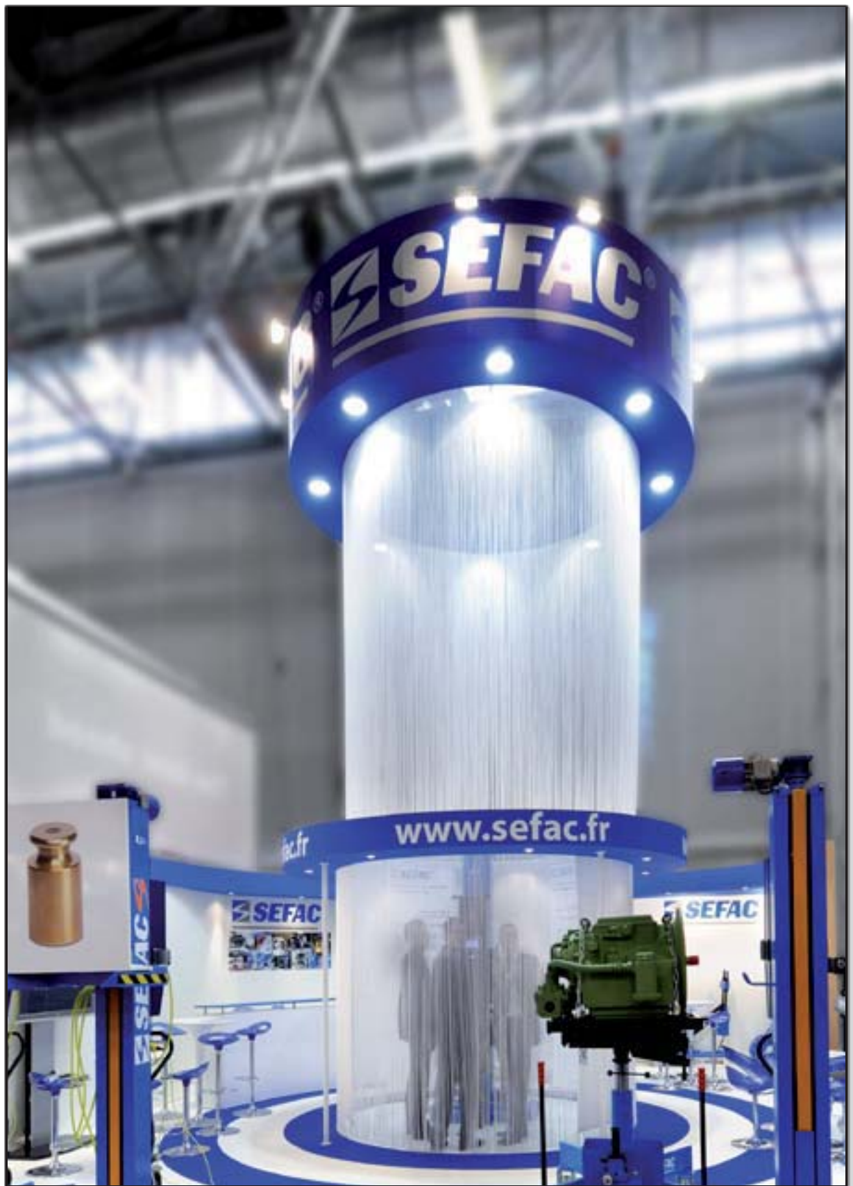
SEFAC - Equip' Auto