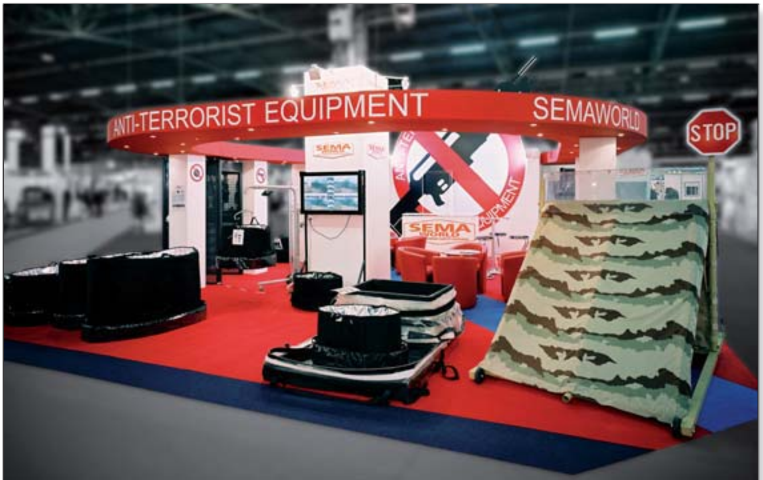
SEMA WORLD - Milipol