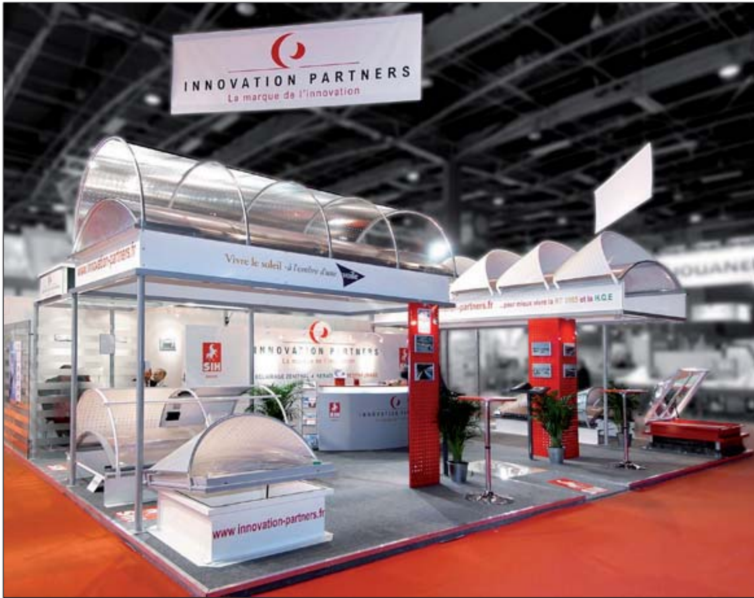
INNOVATION PARTNERS - Batimat