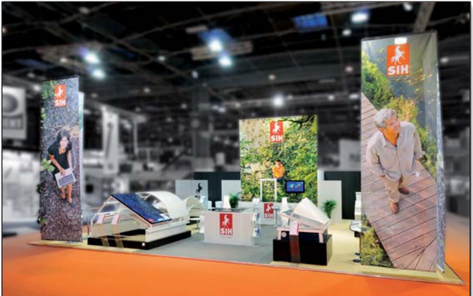
SIH - Batimat