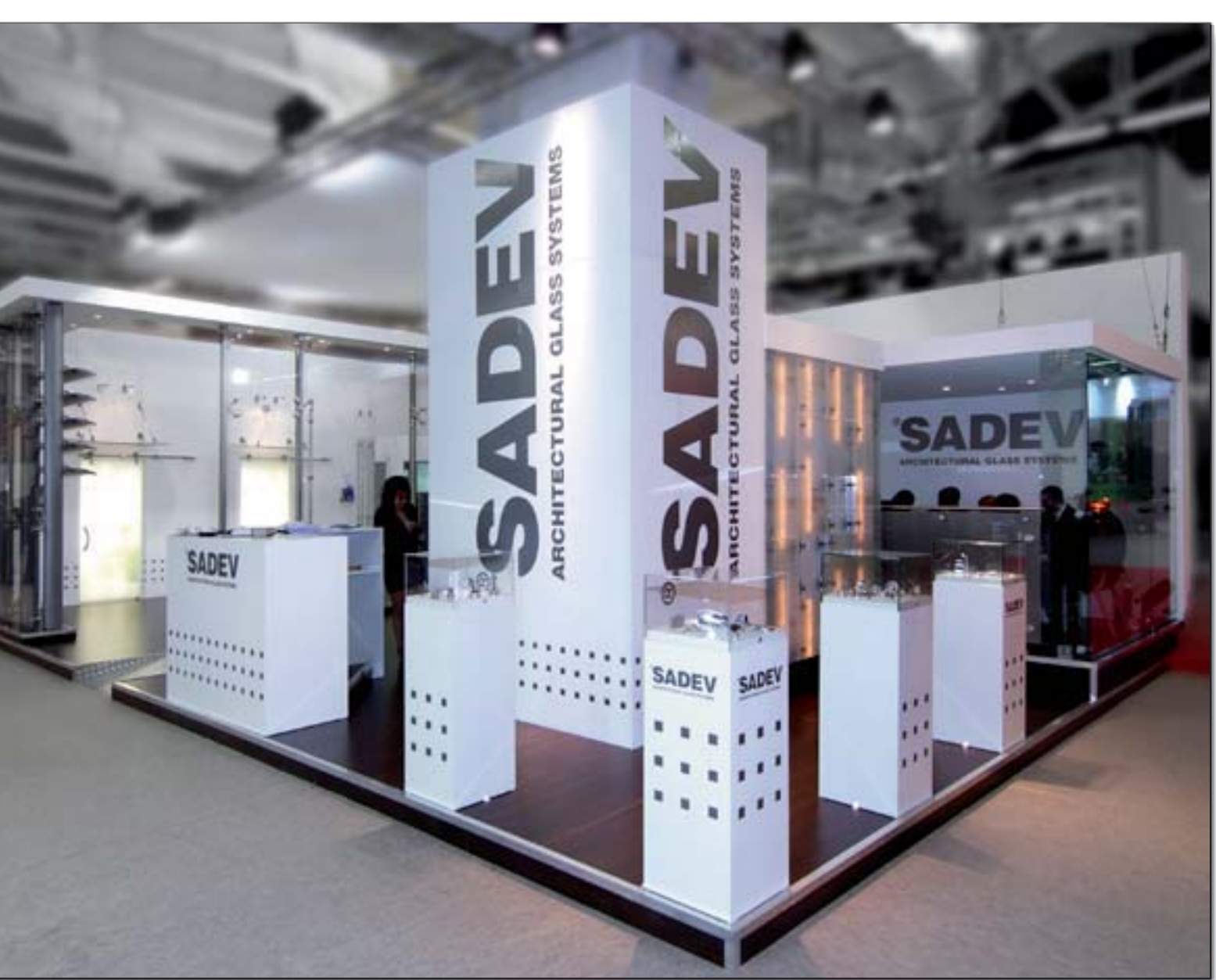
SADEV - Batimat