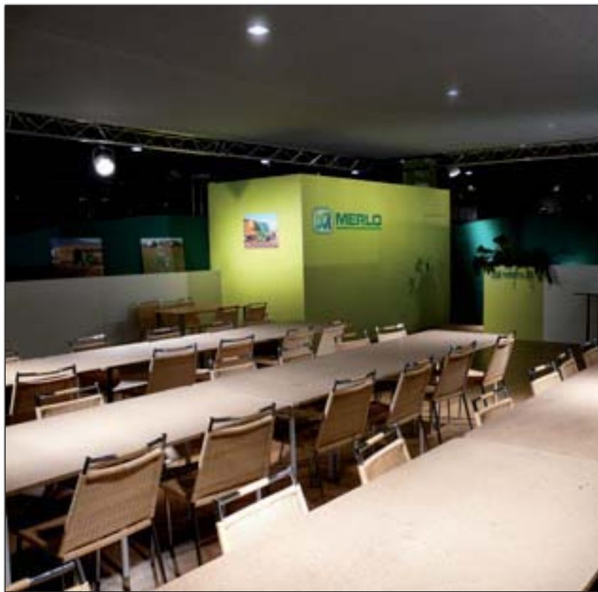
MERLO - SIMA (Salon International de la Machine Agricole)