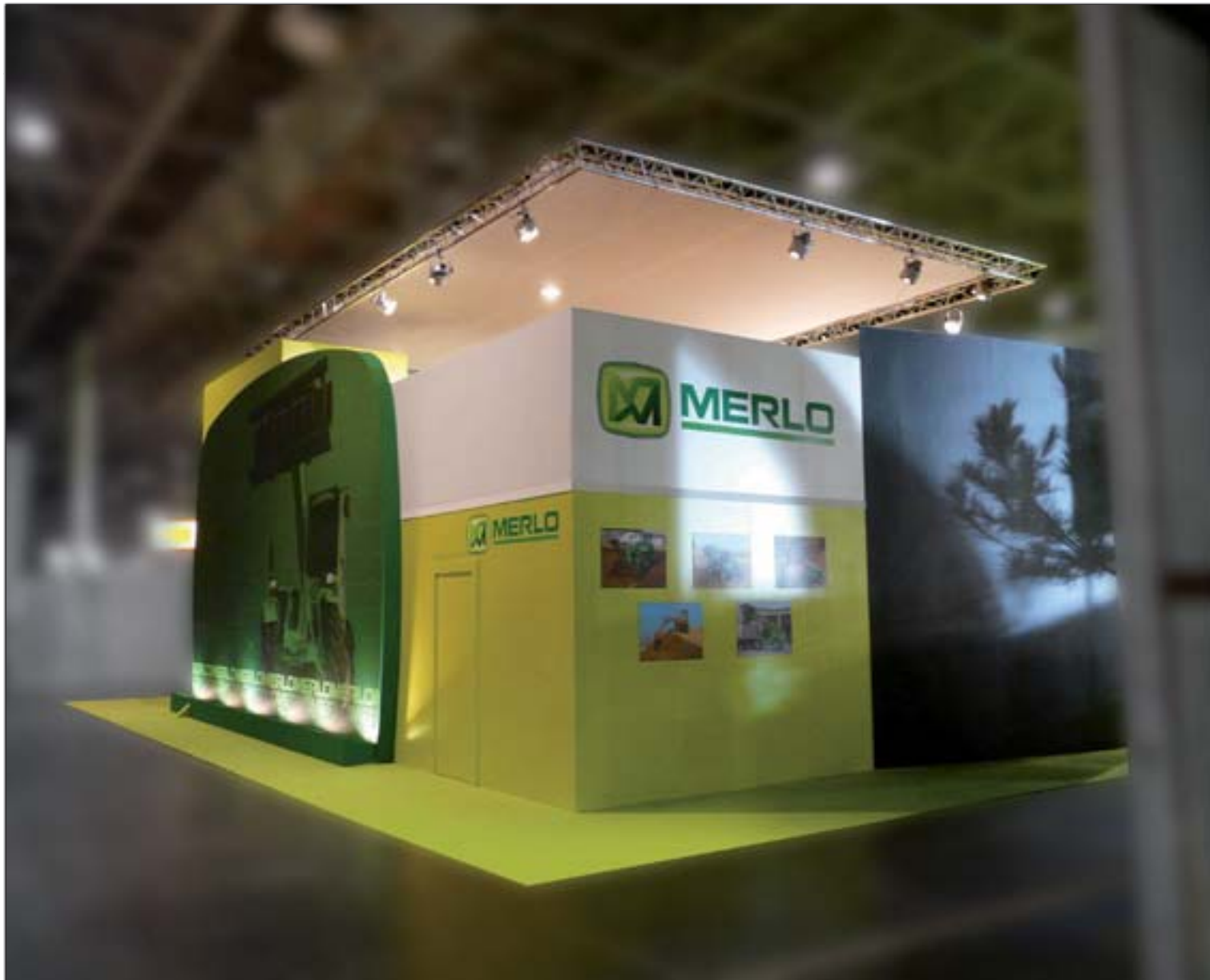
MERLO - SIMA (Salon International de la Machine Agricole)